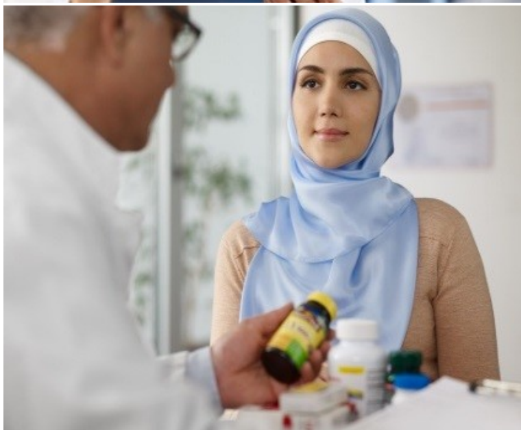
Slika 3. Ženske v skrbi za ohranjanje dobre kondicije svojega telesa..