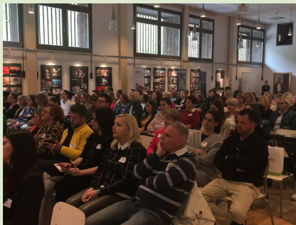
Polna dvorana Kolpern