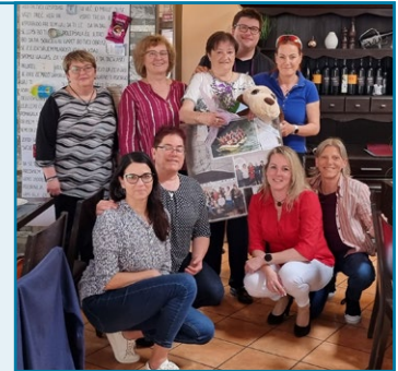
Kolektiv centralne sterilizacije